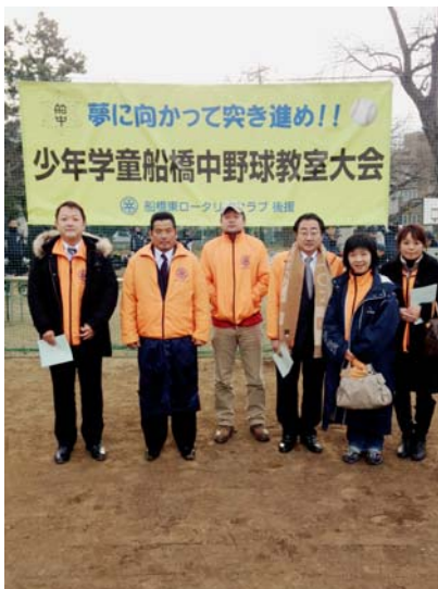
1/12、船橋中、贈呈した横断幕前で