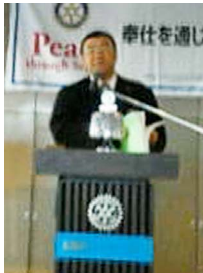
本日の卓話大家会員